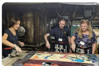
ハンズオンの体験