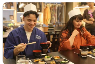
食・ガストロノミー