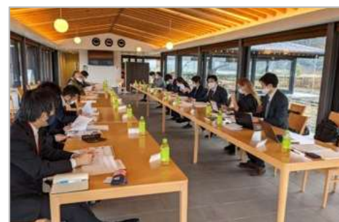
有識者セミナー・伴走支援