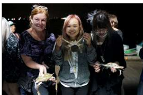
モニターツアー（在日外国人の参加）