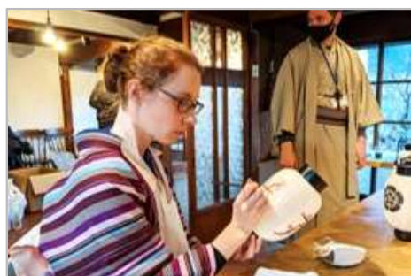
体験コンテンツの造成・磨き上げ

地域経済を支える中小企業・小規模事業者（以下、「事業者」という。）が有する施設やノウハウなどの経営資源を活用し、訪日外国人旅行者を地方に誘客するための体験型観光コンテンツの構築支援をすることで、将来のオーバーツーリズム解消や消費拡大による事業者の売上増加を図ることを目的とした事業です。皆様からのご応募をお待ちしております。